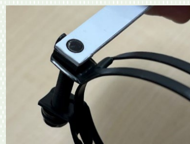
治具で簡単に測れる