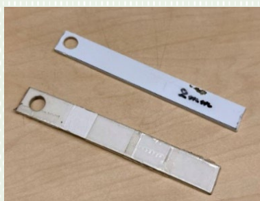
厚紙やプラ板で2mmを 測る治具を製作