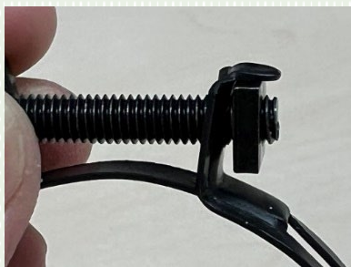
右端のねじ込みは 2mmの指定